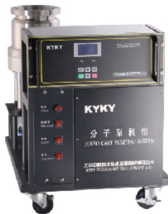
北京中科科仪股份有限公司 KYKY TECHNOLOGY CO., LTD.